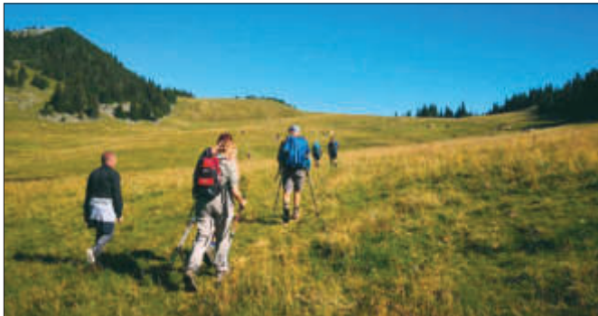
Auf dem Weg zur Magna Mater Austriae

Am 3. Tag gesellten sich weitere 5 Personen – darunter unser Herr Pfarrer - zur Pilgergruppe; vom Niederalpl über Herrenboden und Mooshuabn erreichte die Gruppe um ca. 14.30 Uhr Mariazell.