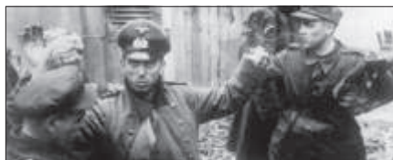
3. Mai 1945 – vier Tage vor der Kapitulation

mord, sein Nachfolger General Dönitz kapitulierte offiziell am 7. Mai 1945.