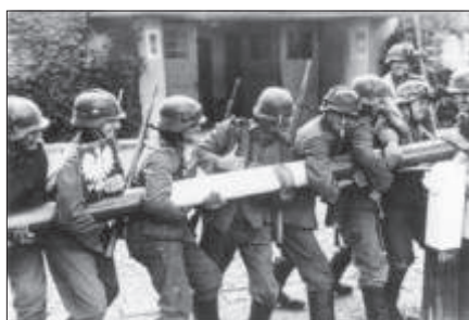
Deutsche Soldaten am polnischen Grenzbalken

Nach dem Anschluss Österreichs an das Deutsche Reich wurde der Weg in den Weltkrieg von Hitler zügig beschritten: In den sogenannten „ Halbjahresschritten “ wurden das Sudetenland (September 1938), die Rest-Tschechoslowakei (März 1939) und am 1. September 1939 Polen überfallen. Damit begann der II. Weltkrieg.