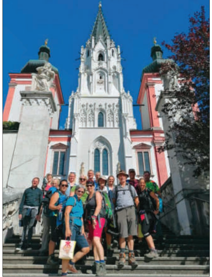
Gruppenbild vor der Basilika

Gemeinsam mit den Buswallfahrern aus Frohnleiten wurde am Freitag, den 21.8. um 16.00 Uhr mit unserem Pfarrer die heilige Messe in der Basilika Mariazell gefeiert.