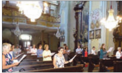
Chorandacht in der Pfarrkirche

Anfang Juli feierten wir außerdem zusammen mit unserem Pfarrer und unserem Pastoralassistenten eine besinnliche Chor-Andacht in der Pfarrkirche, zu der sich alle Sängerinnen und Sänger endlich