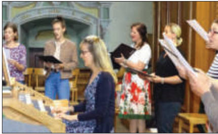
Verkleinerter Chor zu Mariä Himmelfahrt

Wir singen wieder! Beim Hochamt zu Mariä Himmelfahrt brachte bereits ein kleines Ensemble aus dem Chor der Pfarre festliche Kirchenmusik zum Erklingen, und auch ein kurzes Ständchen zum Priesterjubiläum unseres Pfarrers Ende Juni war möglich.