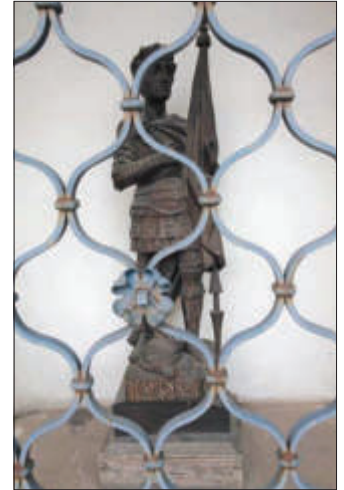
Statue des Heiligen im Marterl an der Murbrücke

Viele Kirchen wurden Mauritius geweiht, eine auch in der nach dem Heiligen benannten, bis Dezember 1951 eigenständigen Gemeinde Mauritzen . Dieses Gotteshaus wurde allerdings um 1800 abgerissen. Der Kirtag in Mauritzen am 3. Sonntag im September hat wahrscheinlich mit dem Patrozinium dieser Kirche zu tun, weil der Gedenktag des hl. Mauritius am 22. September gefeiert wird. Heute erinnert noch ein Bildstock an der Murbrücke an ihn.