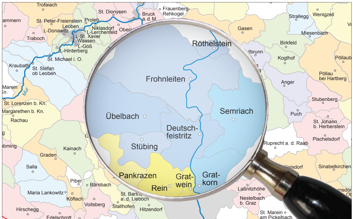
Vergrößerte Darstellung unseres Seelsorgeraumes