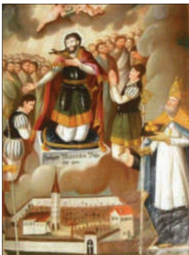
Darstellung des Heiligen auf einem Gemälde im Kloster

Der Namenspatron, der Hl. Mauritius , lebte im 3. Jahrhundert und stammte aus der Thebais (Gegend um die alte Stadt Theben in Oberägypten). Er war Kommandeur der 22. Legion ( Thebaische Legion ), die sich vorwiegend aus Christen zusammensetzte. Sie wurde aus Afrika herangezogen und über die Alpen geschickt, um in Gallien eine Revolte zu unterdrücken. Wie bei den Römern üblich, wurde die Schlacht durch Abhaltung öffentlicher Opfer vorbereitet. Die Christen weigerten sich aber, den heidnischen Göttern zu opfern. Nach einer anderen Version meuterten sie, als der Tetrarch Maximian sie während der großen Diokletianischen Christenverfolgung gegen ihre Glaubensbrüder einsetzen wollte. Maximian gab erzürnt den Befehl, die Legion zu dezimieren, d. h. jeden zehnten Mann hinzurichten. Eine weitere Dezimierung führte ebenfalls nicht zum Erfolg,